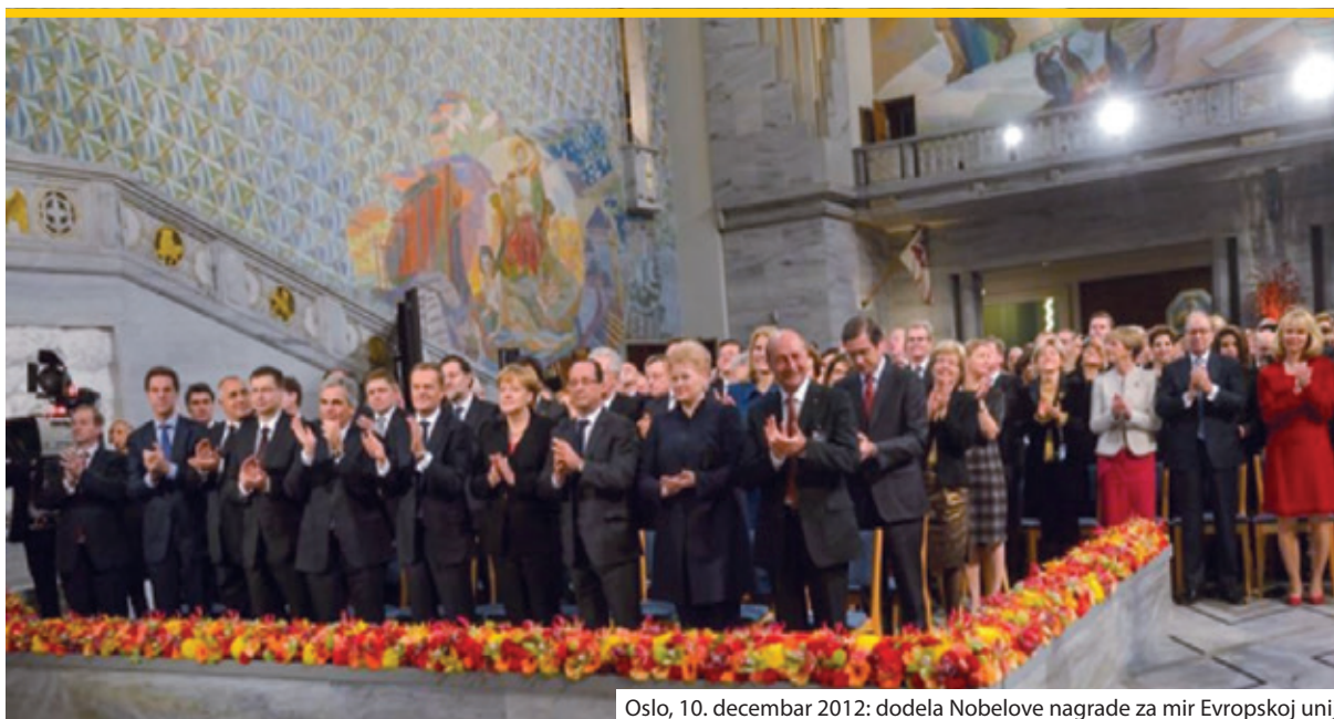
Oslo, 10. decembar 2012: dodela Nobelove nagrade za mir Evropskoj uniji